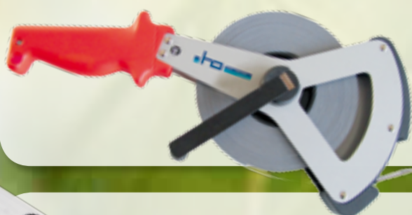
70083 Bandmaß weißlackiert, 50 m