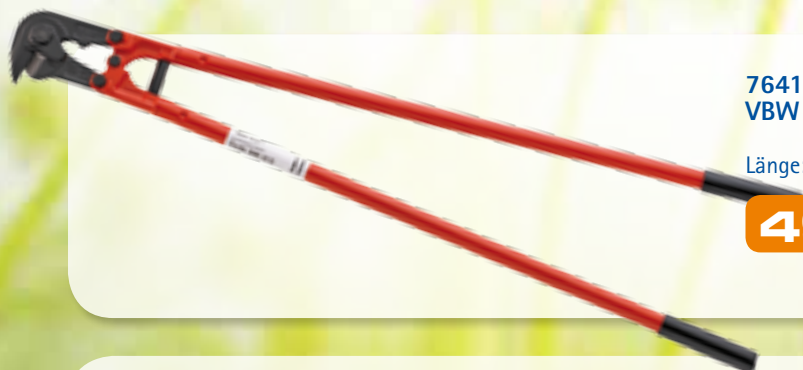
76419 VBW Mattenschneider Nr. 996, Bau Cut