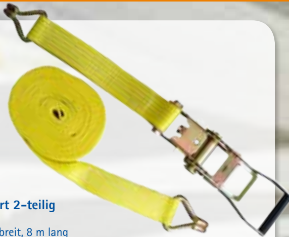
45776 Zurrgurt 2-teilig

50 mm breit, 8 m lang mit Ratsche und Spitzhaken 2000/4000 daN