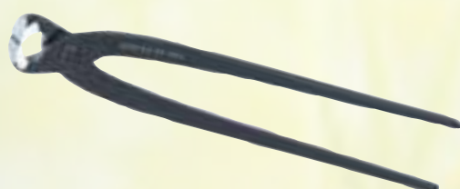
75617 Monierzange 280 mm