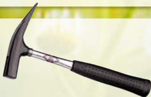
75361 PICARD Latthammer Bauausführung - 400S