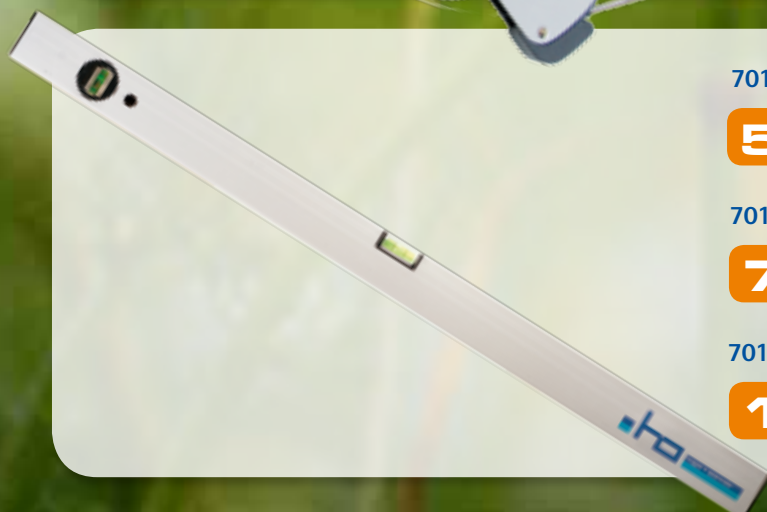
70122 Wasserwaage Aluminium 800 mm