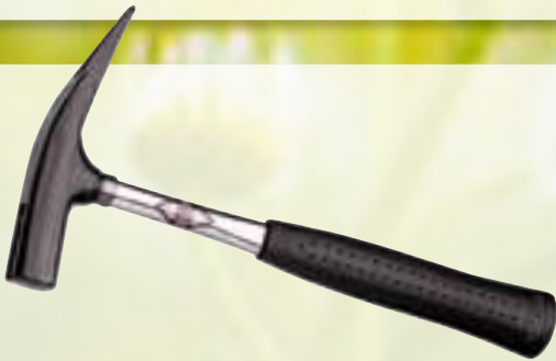
75361 PICARD Latthammer Bauausführung - 400S