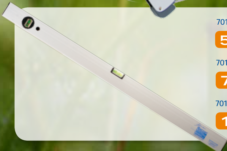
70122 Wasserwaage Aluminium 800 mm