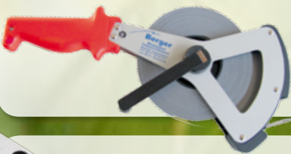
70083 Bandmaß weißlackiert, 50 m